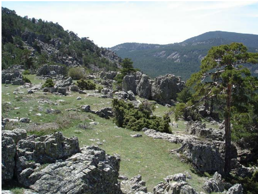
Figura 2: Fotografía del dominio de paisaje Montaña media metamórfica ibérica con matorral, frondosas y coníferas. Macizo del Tremedal.