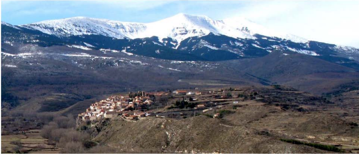
Figura 1: Fotografía del dominio de paisaje Montaña media metamórfica ibérica con matorral, frondosas y coníferas. Vista del Moncayo.