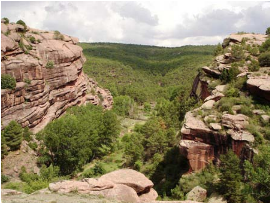
Figura 2: Fotografía del dominio de paisaje Relieves del Rodeno con pinares. Relieves turriculares en el Barranco del Cabrerizo dentro del Paisaje Protegido de los Pinares de Rodeno.