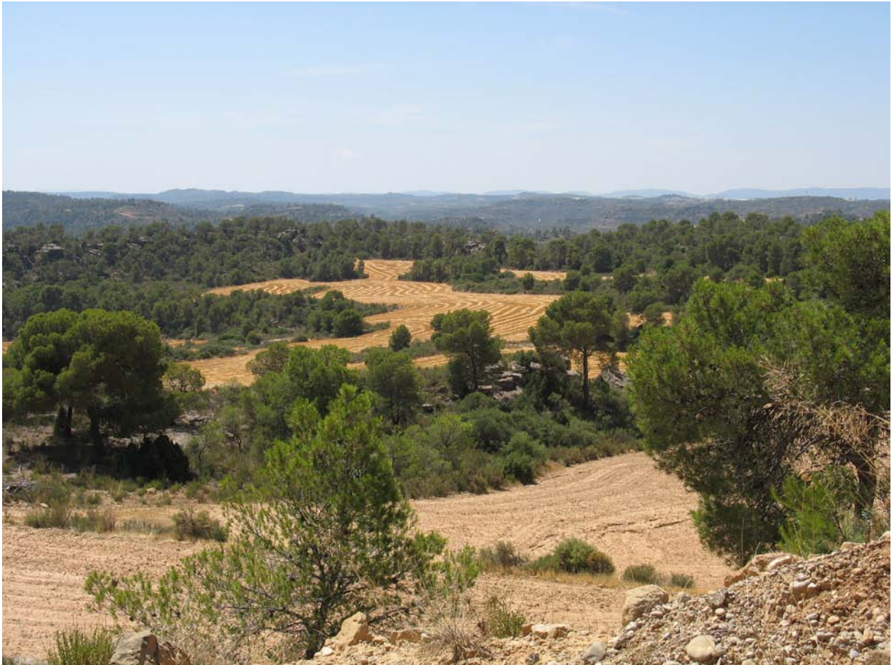
Figura 1: Fotografía del dominio de paisaje Secanos y regadíos entre paleocanales. Vista de conjunto del sector Alcañiz-Caspe