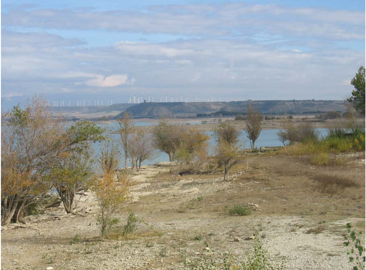
Figura 1: Fotografía del dominio de paisaje Cuestas calcáreas con secanos en el entorno del embalse de La Sotonera. Provincia de Huesca.