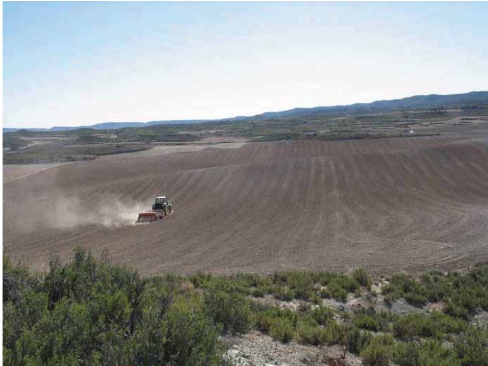
Figura 1: Fotografía del dominio de paisaje Lomas con secanos, cultivos matorralizados y pinares, desde la ermita de Moncalvo, Sariñena.