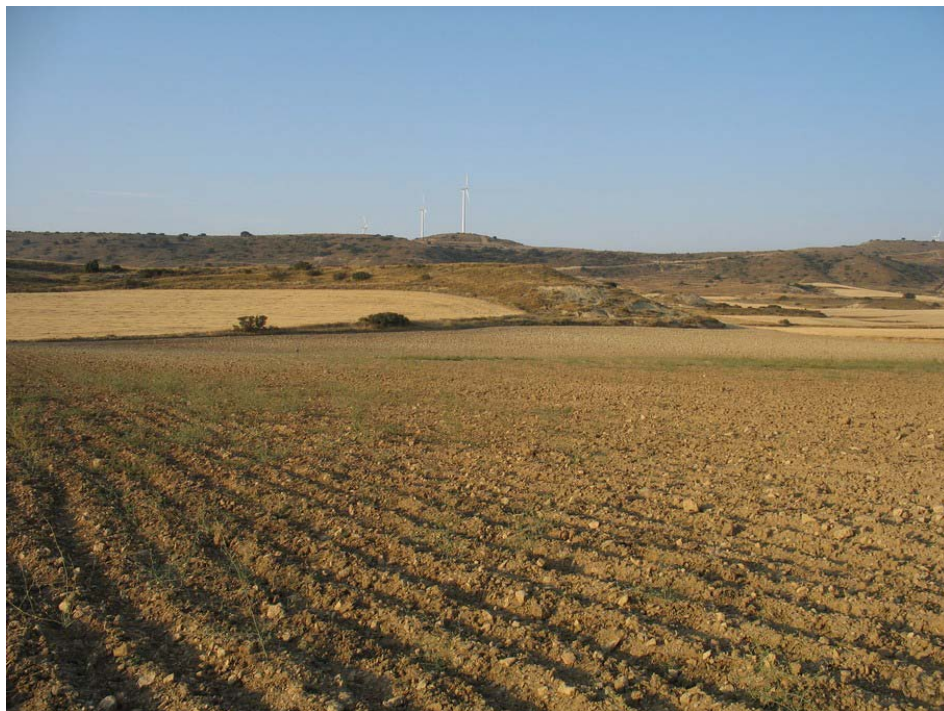
Figura 2: Fotografía del dominio de paisaje Lomas con secanos, cultivos matorralizados y pinares. Tardienta.