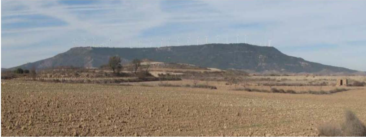
Figura 1: Fotografía del dominio de paisaje Muelas con secanos, pinares y matorral. Muela de Borja desde la carretera A-1302.