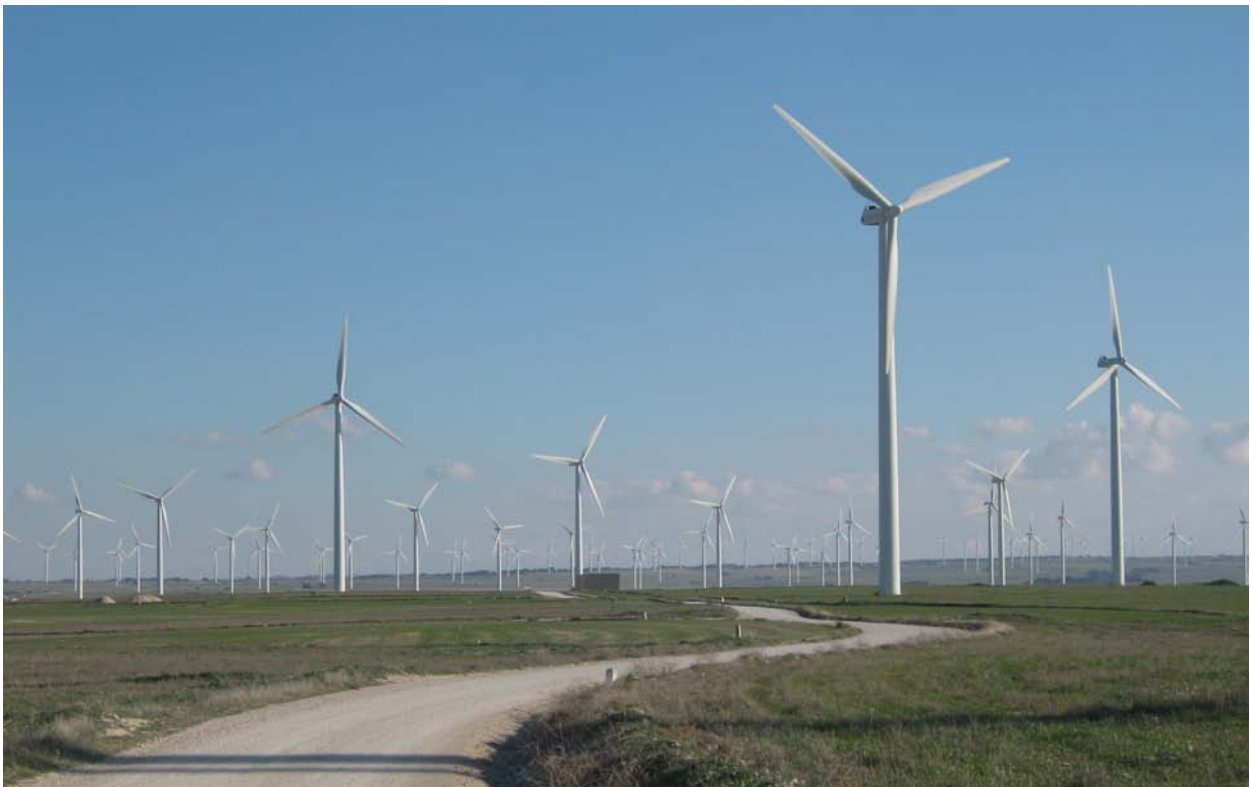
Figura 2: Fotografía del dominio de paisaje Muelas con secanos, pinares y matorral. Plataforma superior de la Plana de María de Huerva.