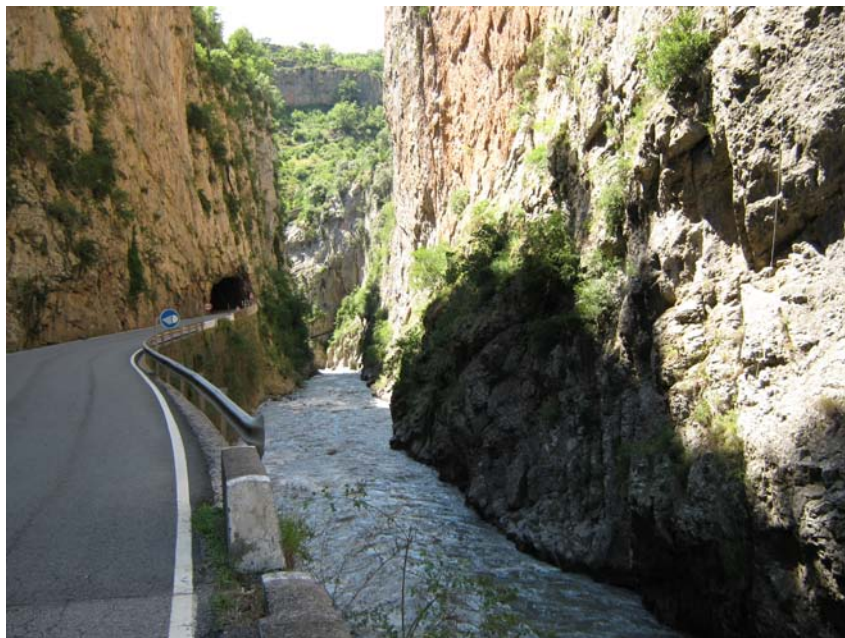
Figura 2: Fotografía del dominio de paisaje Cañones pirenaicos con paredones, frondosas y matorrales. Congosto de Ventamillo.