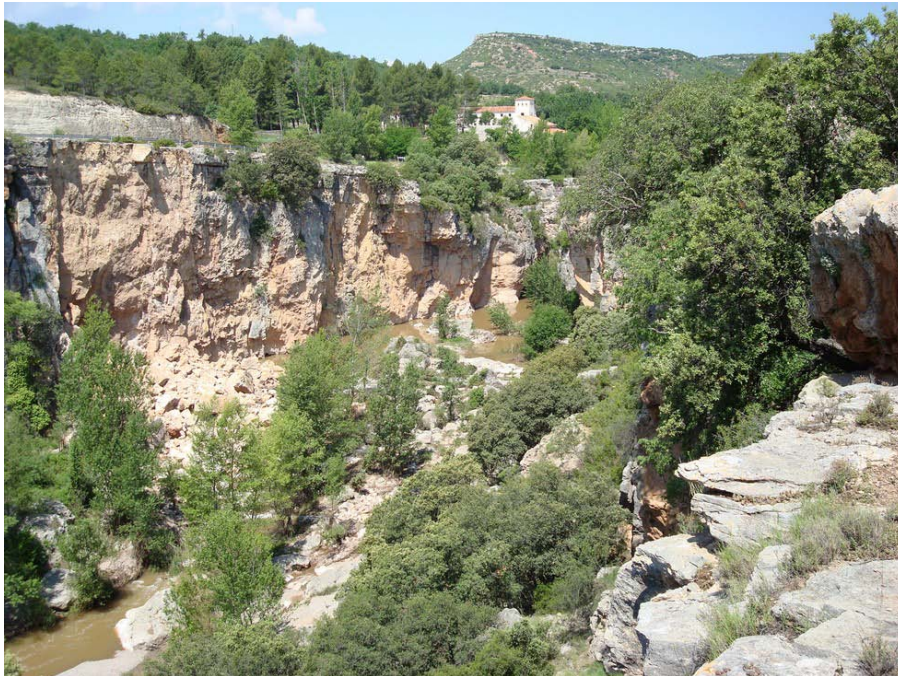
Figura 1: Fotografía del dominio de paisaje Cañones ibéricos con paredones, coníferas y matorrales. Hoz del río Mijares en la Fonseca.