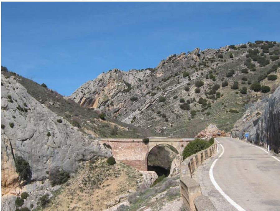
Figura 2: Fotografía del dominio de paisaje Cañones ibéricos con paredones, coníferas y matorrales. Cañón del río Aguas Vivas aguas arriba de Segura de Baños.