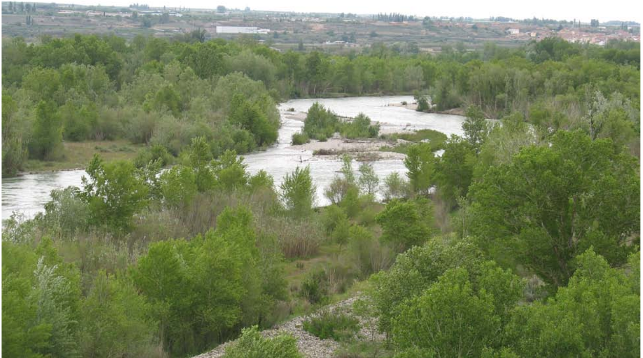
Figura 1: Fotografía del dominio de paisaje Secanos y regadíos en terrazas fluviales escalonadas en las inmediaciones de Chalamera.