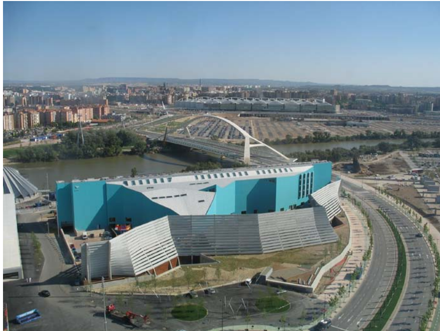
Figura 1: Fotografía del dominio Paisajes Urbanos. Vistas de Zaragoza.