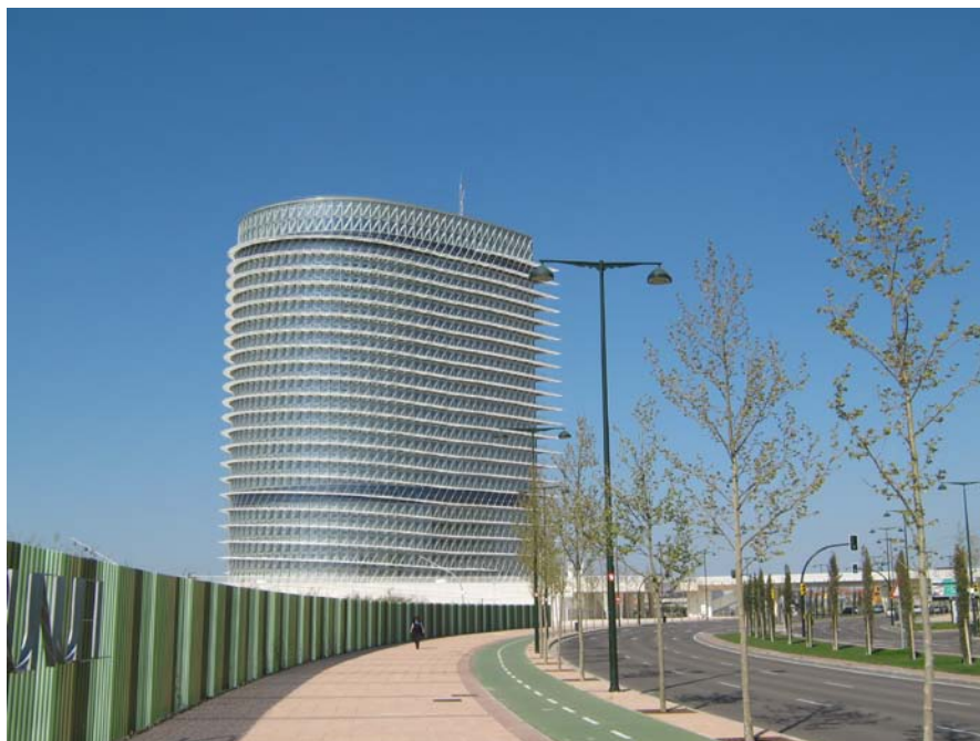
Figura 2: Fotografía del dominio Paisajes Urbanos. Vistas de la Torre del Agua. Zaragoza.