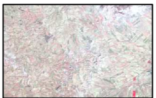
CULTIVO DE SECANO