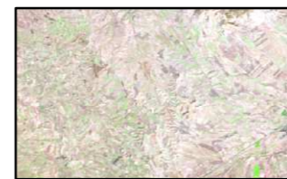
CULTIVO DE SECANO