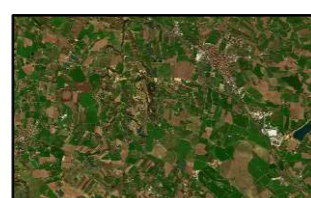
CULTIVO DE REGADÍO