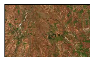
CULTIVO DE SECANO